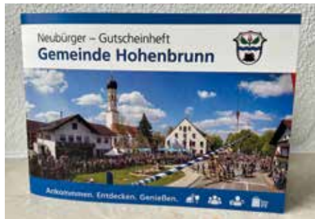
Gutscheineheft für Neubürger

Die Wirtschaftsförderung der Gemeinde Hohenbrunn führt ein neues Angebot für Neubürgerinnen und Neubürger ein. Ab sofort erhalten alle Personen, die ihren Hauptwohnsitz neu in Hohenbrunn anmelden, ein Neubürger-Gutscheineheft. Pro Haushalt wird jeweils ein Gutscheineheft ausgegeben. Das Gutscheineheft im praktischen Briefformat soll den Einstieg in den neuen Heimatort erleichtern und dazu einladen, Hohenbrunn und Riemerling näher kennenzulernen. Zahlreiche örtliche Vereine, Unternehmen und Institutionen sind deshalb mit tollen Angeboten dabei. Wir wünschen allen Neubürgerinnen und Neubürgern viel Freude beim Kennenlernen unserer Gemeinde und hoffen, dass Sie sich bei uns schnell wohlfühlen.