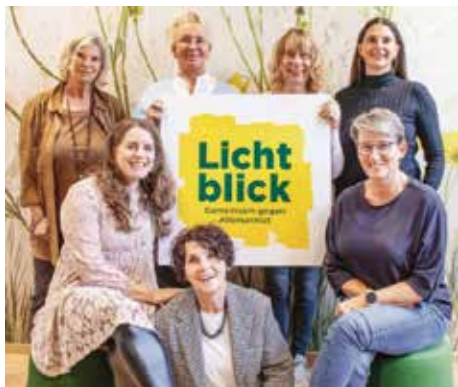
Das Team der Seniorenhilfe Lichtblick

Wir verzeichneten einen neuen Spendenrekord und können vier Senioren-Patenschaften im Gesamtwert von 1.680 Euro übernehmen. So helfen wir älteren Menschen, deren Rente trotz eines langen Arbeitslebens oft nicht für das Nötigste reicht. Das zeigt, was die Gemeindeverwaltung Hohenbrunn ausmacht: Wir setzen gemeinsam ein Zeichen der Menschlichkeit. Ein riesiges Dankeschön an alle Kolleginnen und Kollegen, die das mit ihrer Spende möglich gemacht haben.