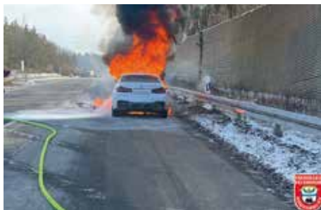
BMW M5 auf Staatsstraße 2078 in Vollbrand

Am 06.01.2026 gegen Mittag wurde die Feuerwehr Hohenbrunn zu einem Fahrzeugbrand auf der Staatsstraße 2078 alarmiert. Ein BMW M5 stand beim Eintreffen der Einsatzkräfte bereits in Vollbrand, bereits auf der Anfahrt war von Weitem eine Rauchwolke erkennbar.