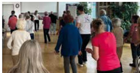
Großes Interesse beim Schnuppertraining im November