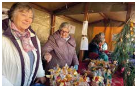
200kg Plätzchen waren nach kurzer Zeit beim Advents-Marktstandl in der Kaiserstiftung ausverkauft

Das Team der Kaiserstiftung bedankt sich für diese großzügige Spende!