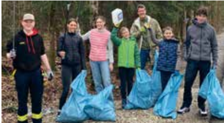
RAMA DAMA am Waldesrand

In diesem Jahr durften wir erneut zahlreiche engagierte Freiwillige zur Aufräumaktion „RAMA DAMA“ willkommen heißen. Die Veranstaltung, an der sich unter anderem die Hohenbrunner Wasserbüffel, die junge CSU-Union Hohenbrunn-Riemerling sowie die Freiwillige Feuerwehr Hohen-