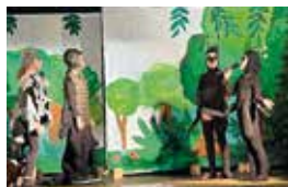
Eule findet den Beat mit Gefühl

Zunächst wurden Rollen und Lieder in den einmal wöchentlich stattfindenden Arbeitsgemeinschaften eingeübt. Nach nur 12 AG-Stunden standen die Kinder dann, am Freitag, den 09.02.2024 auf der Bühne und durften vor knapp 300 Zuschauern unter tosendem Applaus über sich hinaus-