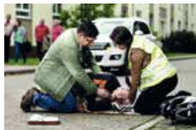
Erste Hilfe rettet Leben