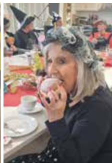
Fasching in der Kaiserstiftung