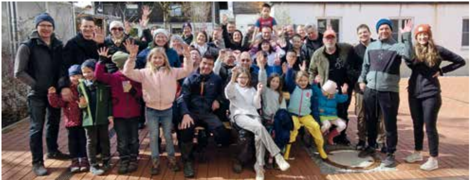
Brotzeittreffen nach getaner Arbeit am Rathaus

Als Anerkennung für die geleistete Arbeit wurde den Helfern am Rathaus eine stärkende Brotzeit angeboten. Wir möchten diese Gelegenheit nutzen, um allen Beteiligten, Jung und Alt, für ihren tatkräftigen Einsatz zu danken und appellieren an die gesamte Gemeinde, sich für eine sachgerechte Müllentsorgung einzusetzen.