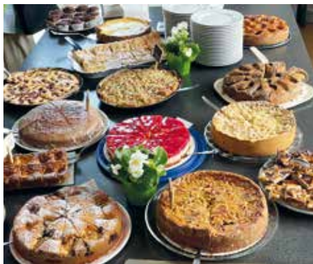
Freude am Kochen und Backen in der Kaiserstiftung

Genießen Sie den wunderbaren Duft eines frisch gebackenen Kuchens? Erfreuen Sie sich an einer ehrenamtlichen Tätigkeit, die Seniorinnen immer wieder mal sonntags zum Schwärmen bringt?