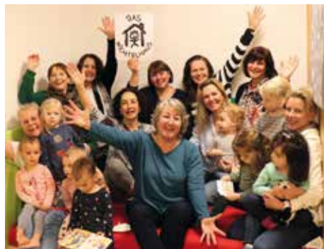
Spaß im Wichtelhaus

Im Wichtelhaus wird zurzeit fleißig gebastelt und die Kinder freuen sich schon auf den Osterhasen. Unser Garten fängt an zu blühen und die ersten Kinderjuchzer sind